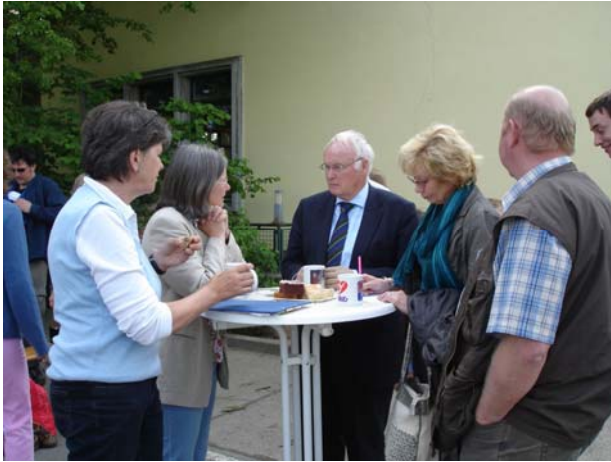
Heinke Kelm im Gespräch mit dem niedersächsischen Umweltminister Hans-Heinrich Sander in Plate