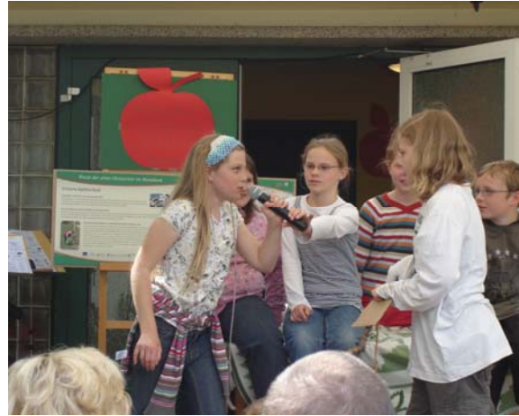
Theaterstück in der Apfelschule Plate