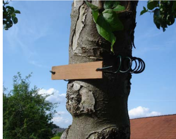
Prototyp zur Befestigung von Sortenschildern, entwickelt von Reinhard Heller

Insgesamt wurden 14 Informationstafeln zu verschiedenen Themenbereichen aufgestellt, 50 Schilder „Blick über den Gartenzaun“, 50 Wegweiser und 600 Sortenschilder angebracht.