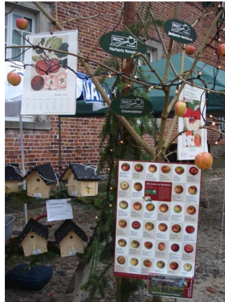
Weihnachtsmarkt in Gartow 2009