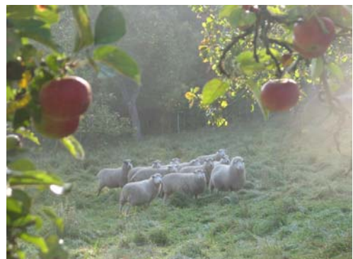
BUND-Wiese in Pevestorf

Das Wendland bietet eindrucksvolle Möglichkeiten, sich an blühenden Streuobstwiesen, idyllischen Alleen und imposanten Einzelbäumen zu erfreuen. Einheimische und Touristen können hier ihre Kenntnisse über die alten Obstsorten erweitern und den Wert der alten Obstsorten für Mensch und Natur sinnlich erfahren.