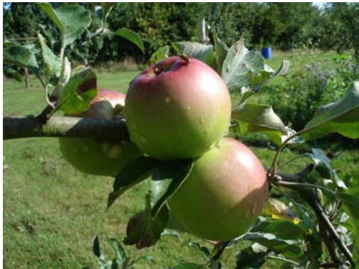
Taurischer Apfel in Kriwitz

Das Förderprogramm Natur Erleben in Niedersachsen des Ministeriums für Umwelt und Klimaschutz Niedersachsen, das zum Ziel hat, den natürlichen Reichtum einer Region stärker als bisher für die Menschen zugänglich und erlebbar zu machen, hat die Durchführung des Projektes aus Mitteln des Europäischen Fonds für regionale Entwicklung (EFRE) und Landesmitteln ermöglicht.