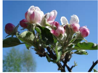
Apfelblüte, Foto: Silke Last