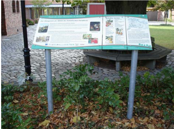
Informationstafel am Pfarrhaus Gartow